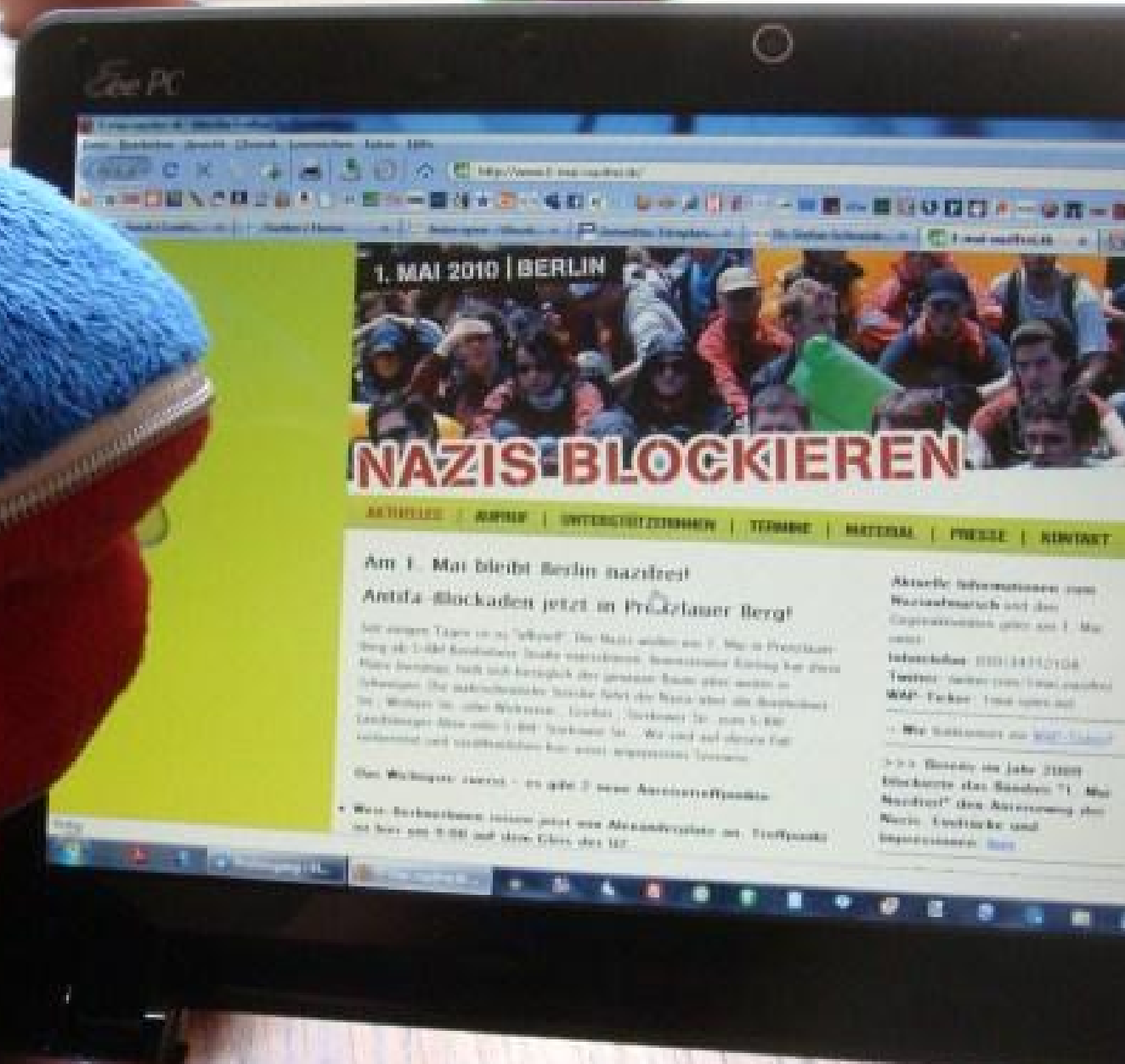
Lilo informiert sich im Internet